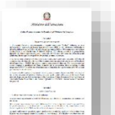
Tabella di corrispondenza tra la violazione dei doveri e le sanzioni disciplinari